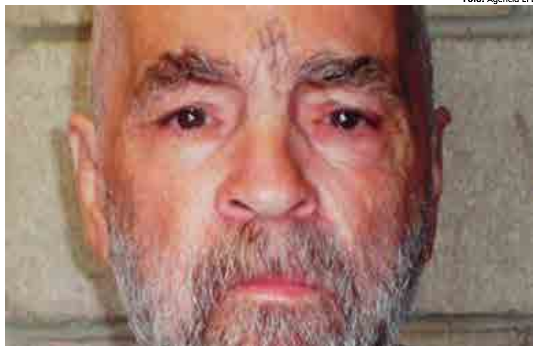
Assassino matou entre outros a atriz Sharon Tate, grávida de um filho do diretor Roman Polanski

O assassino em série morreu em um hospital da cidade de Bakersfield, disse à TMZ a irmã de Sharon Tate, após receber um telefonema de oficiais de Corcoran State, a prisão onde estava Manson, condenado em 1971 pelo seu papel na organização e no planejamento dos assassinatos