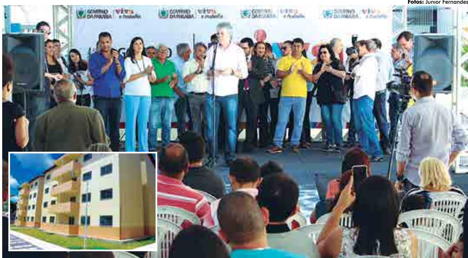
Governador, vice-governadora e auxiliares do governo entregaram o residencial, que possui dois blocos, com 32 unidades cada, com térreo mais três pavimentos