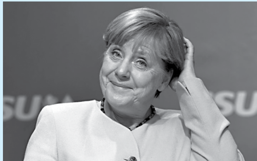
A chanceler lamentou considerar que "o ritmo das conversações indicava que seria possível chegar a um acordo"