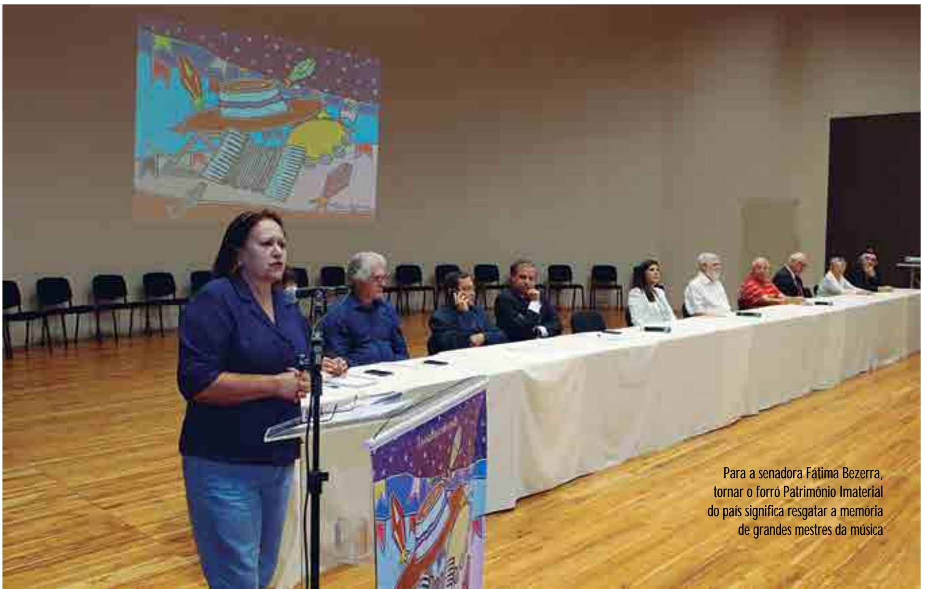
Para a senadora Fátima Bezerra, tornar o forró Patrimônio Imaterial do país significa resgatar a memória de grandes mestres da música

O I Encontro Nacional de Forrozeiros acontece até quarta-feira (22), no Espaço Cultural José Lins do Rêgo. A programação prevê atividades como mesas-redondas, palestras e shows-manifestos com a participação de artistas como Nando Cordel, Alcymar Monteiro, Cezinha, Genival Lacerda, dentre outros. Inscrições e programação disponíveis em: www.encontro-nacionaldeforrozeiros.com