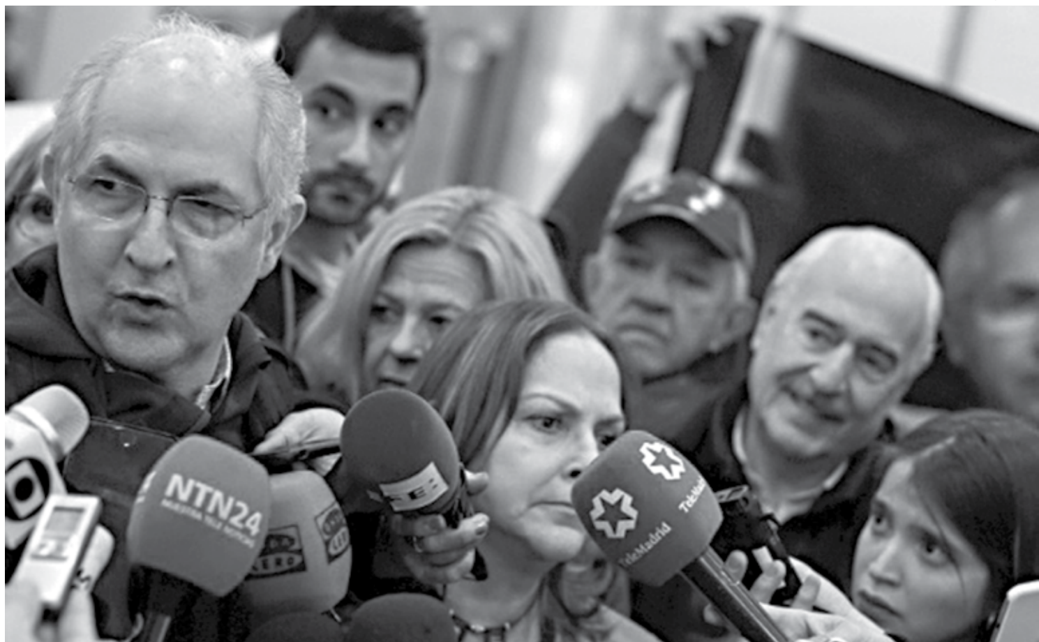
Sua chegada em Madri, (à esquerda) três dias atrás, para onde seguiu agora como um exilado, por temer coisas piores no seu próprio país, como um sequestro

/// Eu não sou útil como posso começar a ser no exílio", declarou em entrevista à imprensa em Madri ///