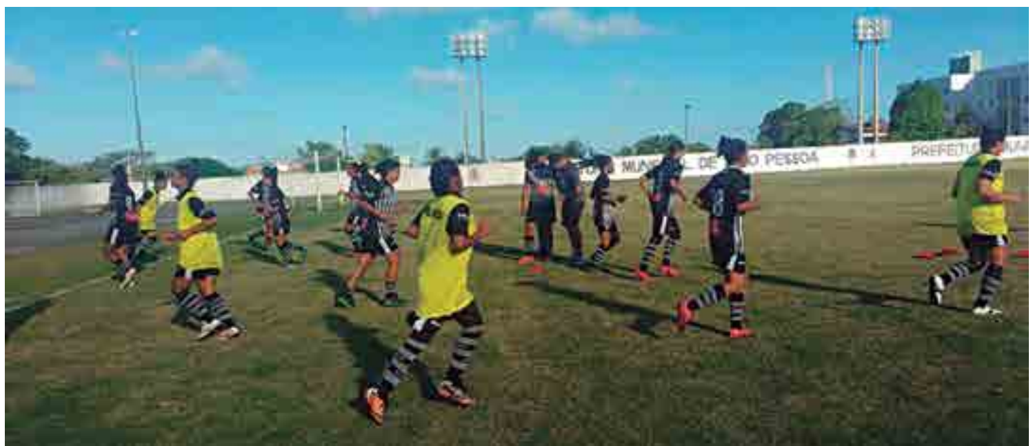
Jogadoras do Botafogo durante aquecimento no CT Ivan Thomaz antes de enfrentar o Auto Esporte pelas semifinais do Campeonato Paraibano