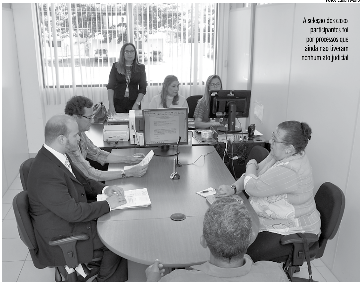
A seleção dos casos participantes foi por processos que ainda não tiveram nenhum ato judicial