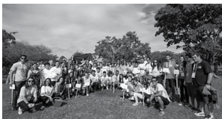
Atletas, técnicos e dirigentes plantam mudas de árvores em Brasília

"Faz algumas edições que a gente chama a atenção para os temas ligados à sustentabilidade e, inclusive, para os impactos do próprio evento. Já fiz os cálculos da emissão de dióxido de carbono, um dos mais impactantes GEE's (gases do efeito estufa), e temos como média que a compensação ou neutralização do nosso impacto