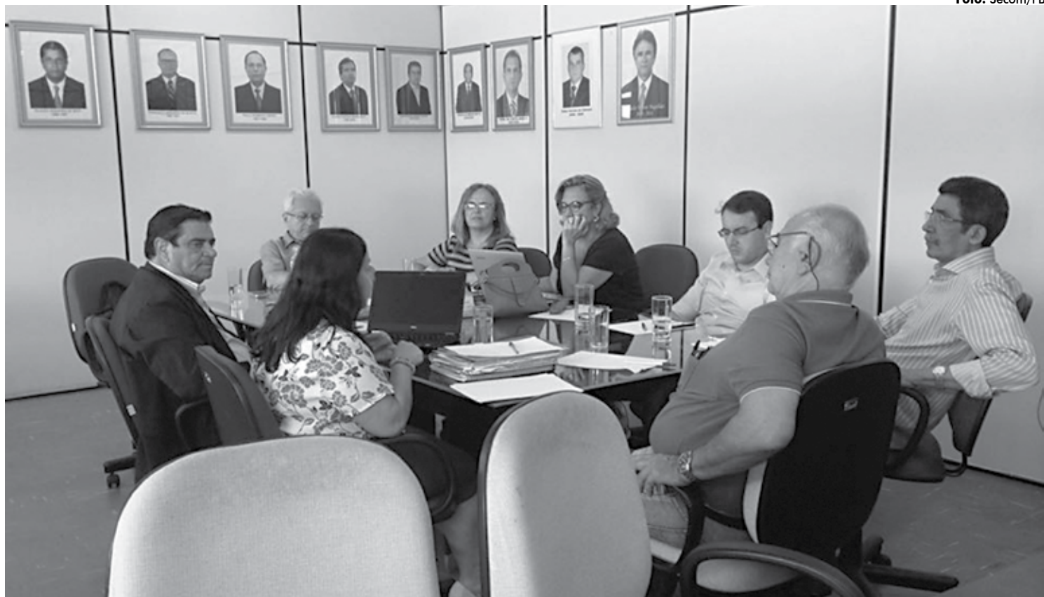
Técnicos já deram início aos trabalhos que vão regularizar títulos de terra e promover a cidadania de famílias instaladas em assentamentos irregulares