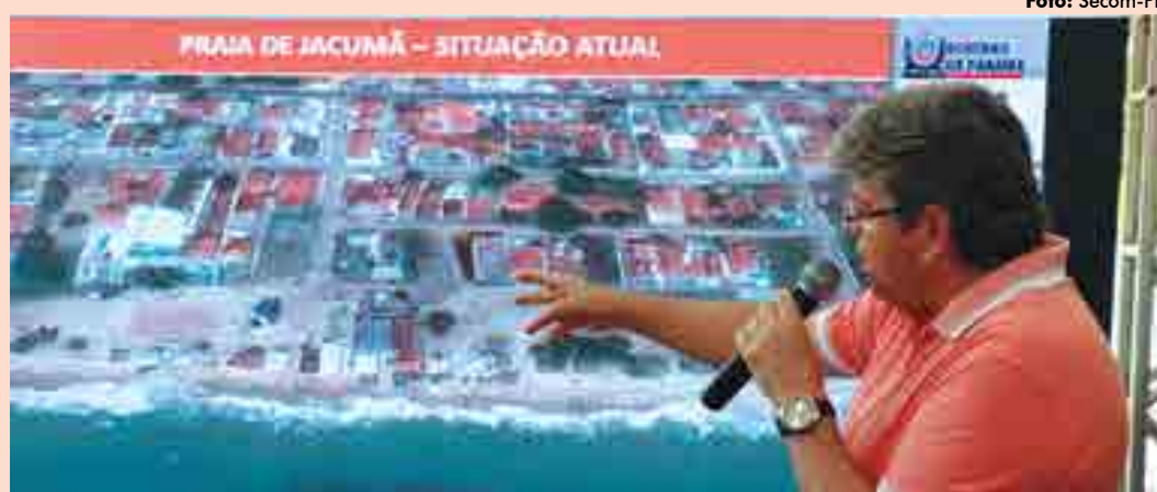
Secretário de Estado de Infraestrutura detalhou as obras na orla do município de Conde, com recursos de R$ 3,7 milhões