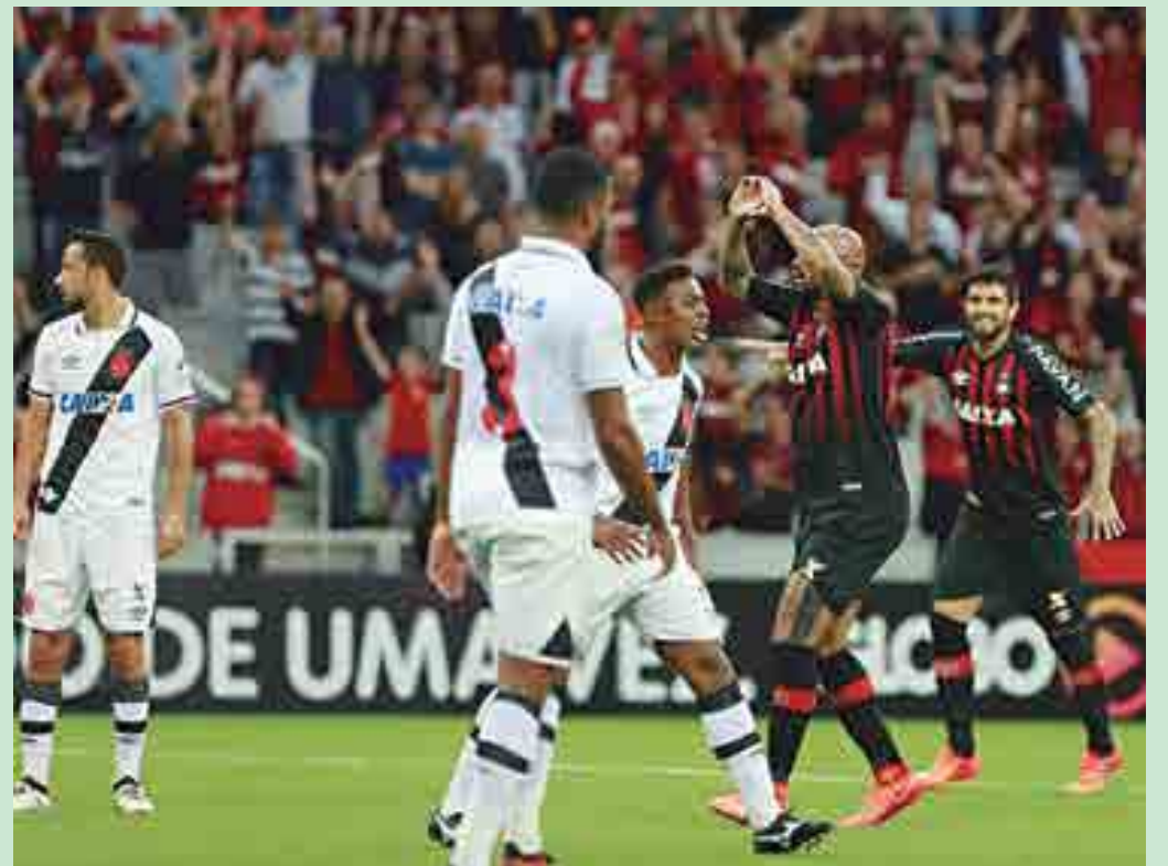
O Vasco da Gama perdeu para o Atlético-PR por 3 a 1. Ficou mais longe da vaga para a Taça Libertadores

“Tenho de assumir que fui um idiota. Infelizmente, minha reação foi destemperada. Mas agora tudo acabou, eu e Ballack nos falamos e não há problemas entre nós”, disse o atacante, que foi multado pela federação alemã.